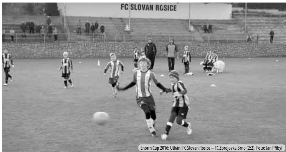
Enorm Cup 2016: Utkání FC Slovan Rosice – FC Zbrojovka Brno (2:2).

téměř 150 dětí a mládeže do 18let, což je nejvíc v historii klubu. Práci s mládeží se u nás věnuje dohromady 25 trenérů, za což jim patří velké uznání a poděkování.