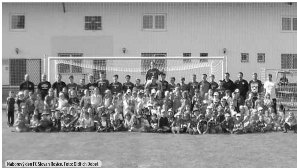
Náborový den FC Slovan Rosice.

Co se týče našich přípravků, všechny čtyři jako tradičně patří mezi nejlepší v okrese Brno-venkov. Novinkou a příjemným zpestřením oproti minulé sezóně je soutěž minipřípravků, kterou hrají nejmenší fotbalisté a fotbalistky Slovanu spolu s dalšími šesti kluby našeho okresu. Naši fotbalovou školičku (minipřípravku) navštěvovalo na začátku října neuvěřitelných 31 dětí, celkově pak členská základna Slovanu Rosice čítá momentálně