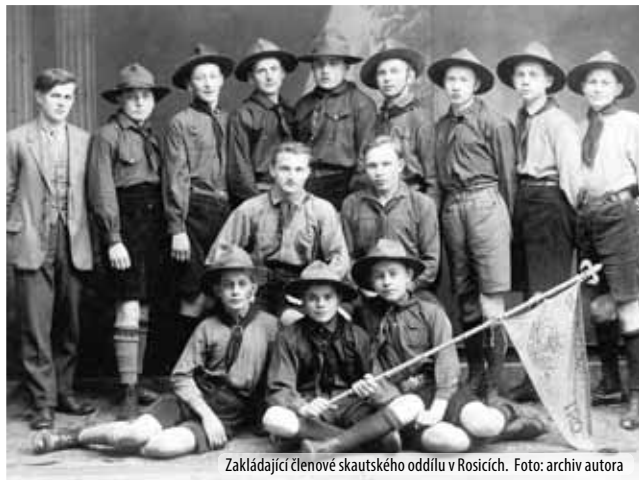
Zakládající členové skautského oddílu v Rosicích.